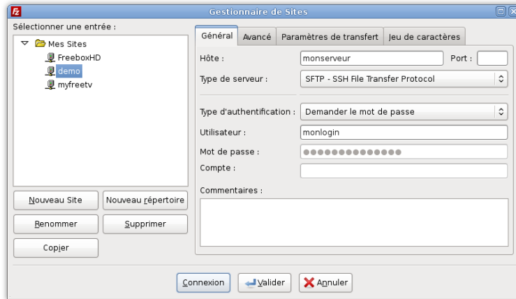
FIG. 3.1 – Gestionnaire de sites de FileZilla