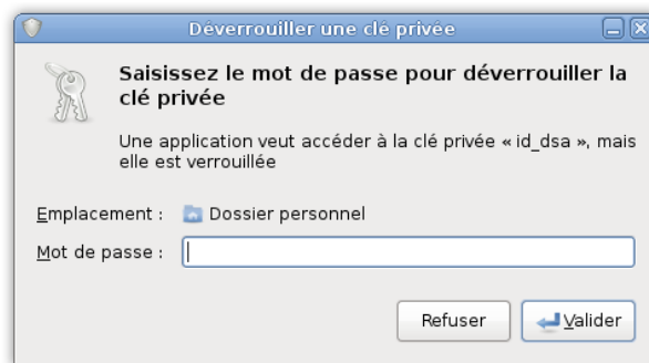
FIG. 2.1 – Demande de passphrase sous Gnome