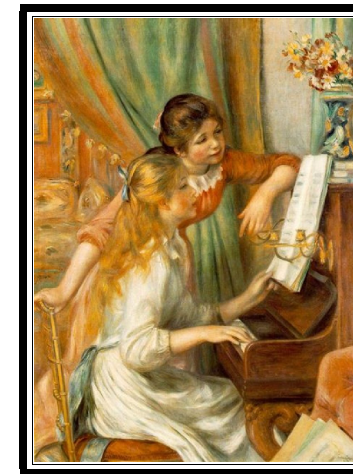
d'après Auguste Renoir Jeunes filles au piano