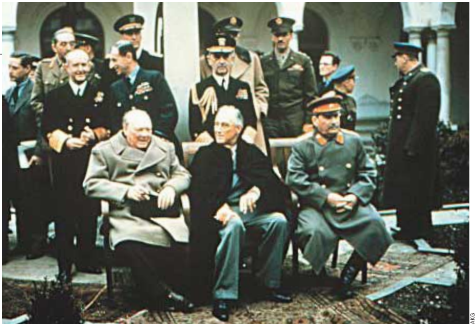
Erstgeborene Churchill, Roosevelt, Stalin*: Bündnis gegen den Zweitgeborenen