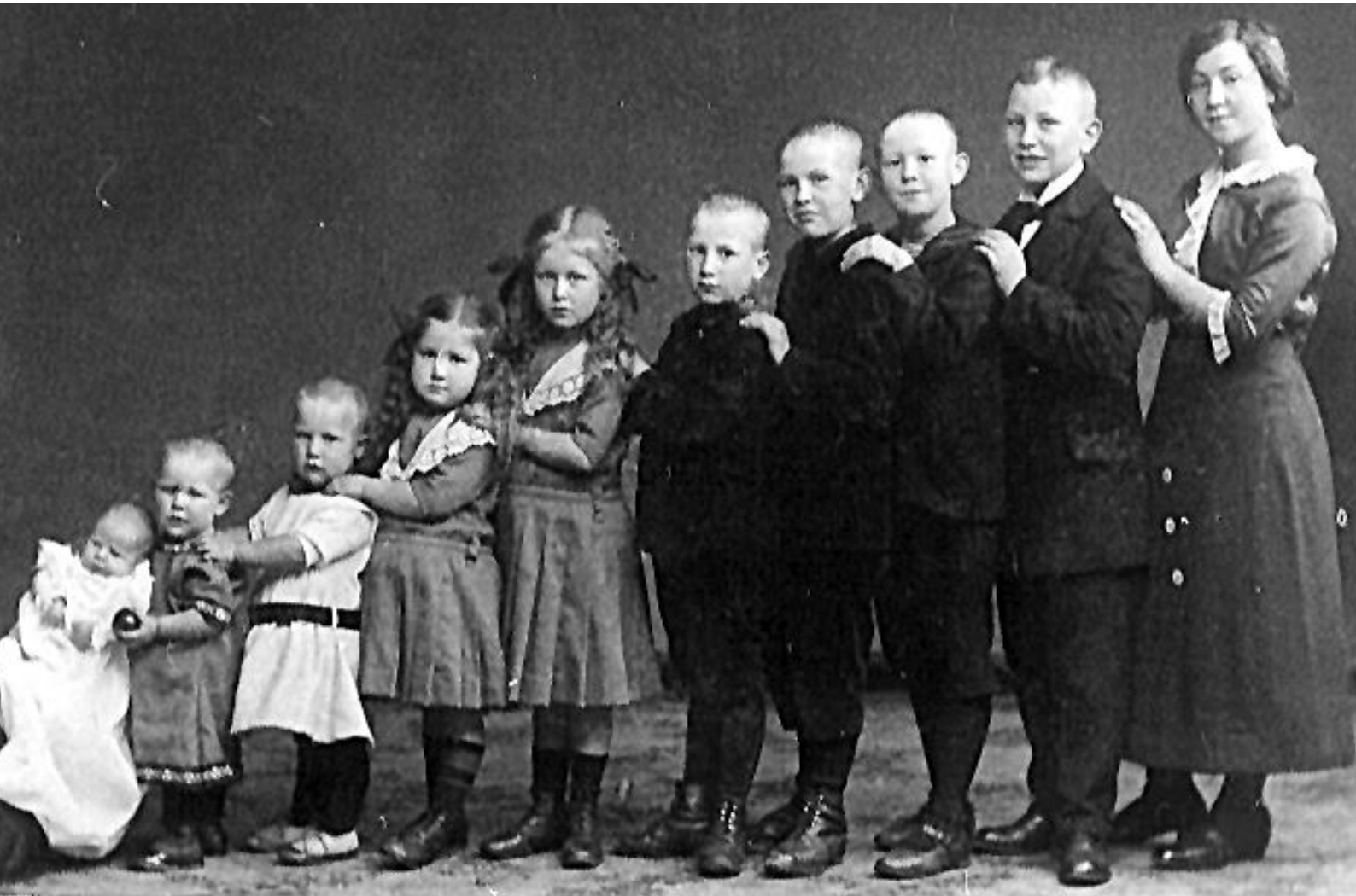
Geschwisterreihe (um 1900): Im Schoß der Familie ein evolutionärer Wettstreit um eine Überlebensnische?